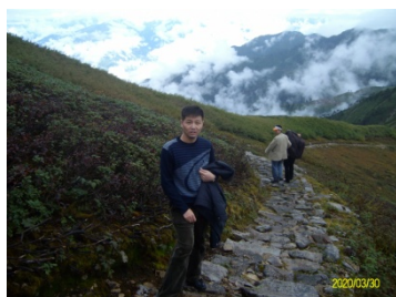
長青在中國鄉間傳道