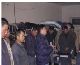
李傳道帶領弟兄們講道。